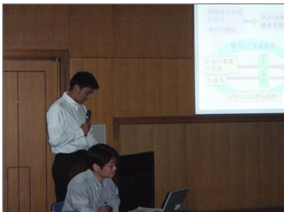
最優秀賞を受賞した新島村農業研究会